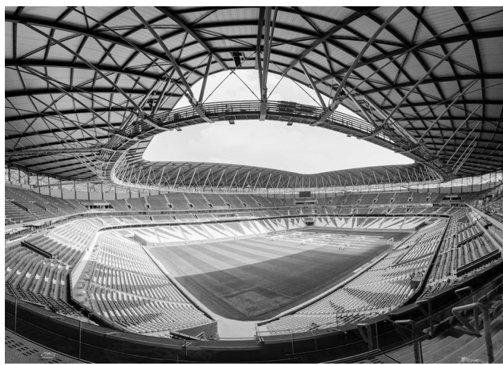
Comitê Organizador da Copa do Mundo de 2022

Jogo entre Catar e Equador abrirá o próximo Mundial