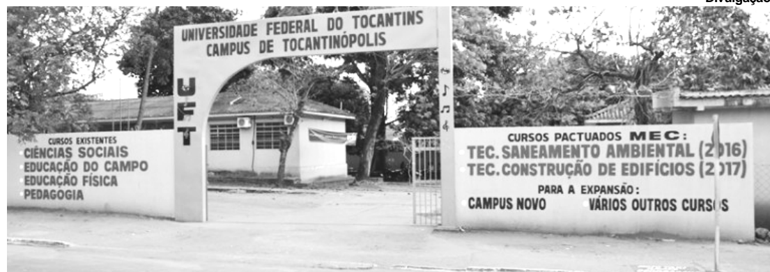
Curso de Direito vai dar mais visibilidade ao Campus da UFT e à cidade de Tocantinópolis

O Ministério da Educação (MEC) autorizou o funcionamento do curso de Direito no campus da Universidade Federal do Tocantins (UFT) em Tocantinópolis por meio da Portaria nº 380, publicada no Diário Oficial da União no dia 6 de novembro.