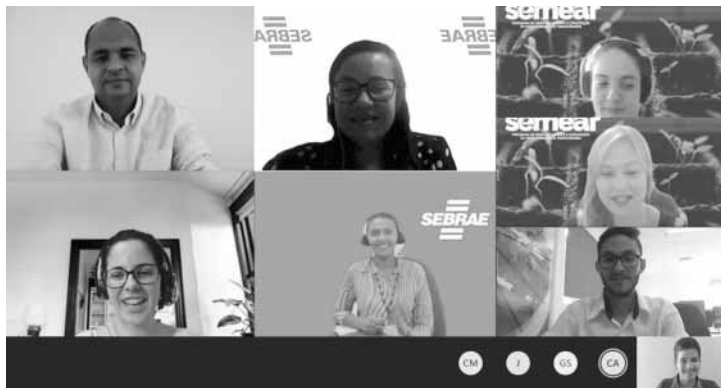
Assessoria de Imprensa Suzano e Sebrae

O programa Semear visa o fortalecimento da micro e pequena empresa para o desenvolvimento regional