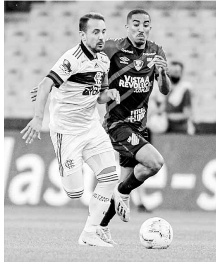
Everton Ribeiro está na Seleção Brasileira

Gabigol não está recuperado das dores na coxa direita, não viaja e aumenta ainda mais a lista de desfalques do Flamengo para enfrentar o São Paulo, quarta-feira, no Morumbi. O atacante fez exame que apontou uma fadiga acentuada no local. Como perdeu por 2 a 1 no Maracanã, a equipe precisa vencer por dois gols de diferença para avançar na Copa do Brasil. Se vencer por um gol, o Flamengo leva a decisão para os pênaltis. Não há critério de “gol fora de casa” no torneio.