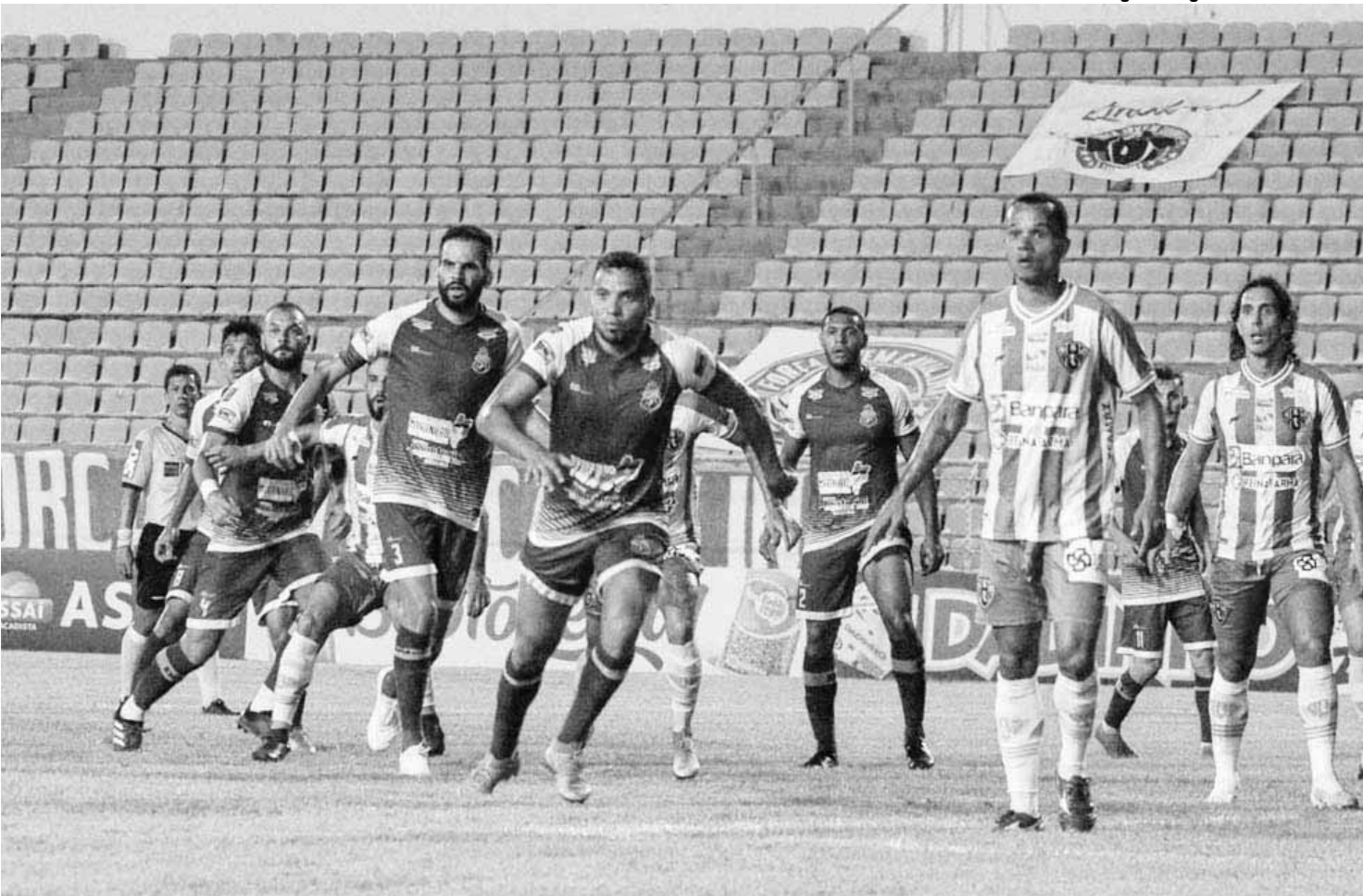
Cavalo de Aço perdeu por 3 a 0 para o Paysandu, no Frei Epifânio