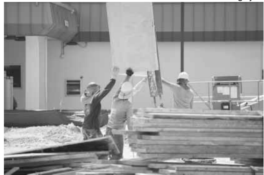
Contrate profissionais especializados para realizar serviços elétricos na sua obra

A eletricidade possui um papel muito importante no dia-a-dia da população, no entanto, quando usada de forma inadequada, pode provocar graves acidentes. Em construções civis o cenário não é diferente, já que, descuidos e improvisos são comuns quando se fala em energia elétrica. Pensando nessas situações, a Equatorial Maranhão faz um alerta sobre as principais medidas de segurança para evitar acidentes envolvendo eletricidade em obras.