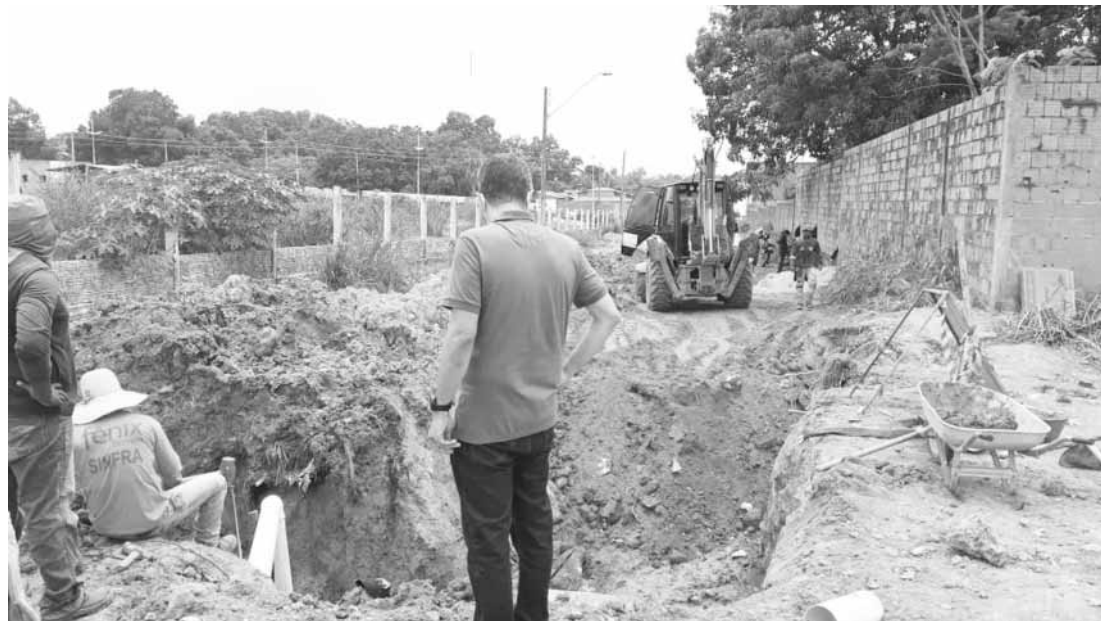
Obras de drenagem profunda avançam nos bairros Parques Alvorada I e das Palmeiras

Os interessados podem conferir as demais informações no edital, disponível no link: https://cultura.prefeitura.deimperatriz.com/static/files/fumic.pdf (Rafael Pestana - Ascom)