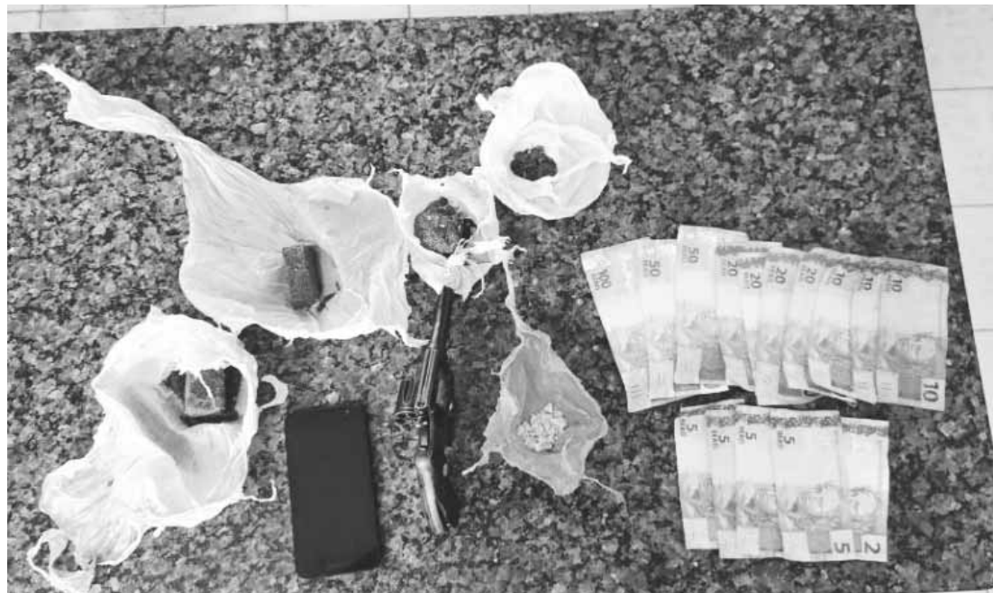
Drogas, arma e munições foram apreendidas durante ação da PM no Setor Sul

Suspeitos ainda tentaram fugir, mas foram encontrados e presos