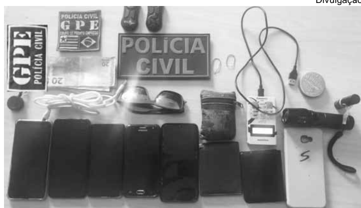
Celulares e outros objetos apreendidos com os acusados

A Polícia Civil do Estado do Maranhão prendeu em flagrante delito em Imperatriz três homens suspeitos de cometerem o crime de Furto Qualificado.