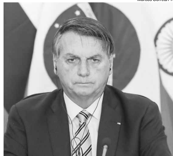
Presidente critica ataques que o Brasil sofre por queimadas

Para Bolsonaro, uma comunidade internacional "verdadeiramente integral e ativa" só será possível com essas reformas. Ele defendeu, também, que os países do Brics coordenem o apoio à redução de subsídios para bens agrícolas por parte da OMC e o acesso permanente de Brasil, Índia e África do Sul ao Conselho de Segurança. "Com esse importante passo, tenho certeza que a cooperação no Brics sairá ainda mais fortalecida", disse.