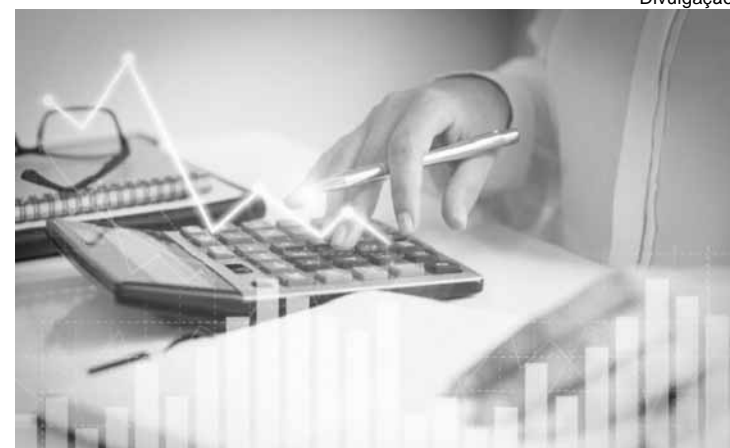
Ação foi movida pelo Sindicato dos Trabalhadores em Educação Básica das Redes Públicas Estadual e Municipais do Maranhão

De outro lado, o juiz fundamentou que uma decisão da 74ª Zona Eleitoral, semana passada, bloqueou as contas